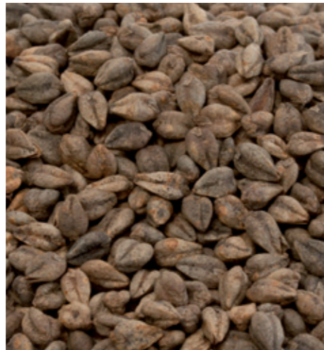
Das ungeschälte Getreide