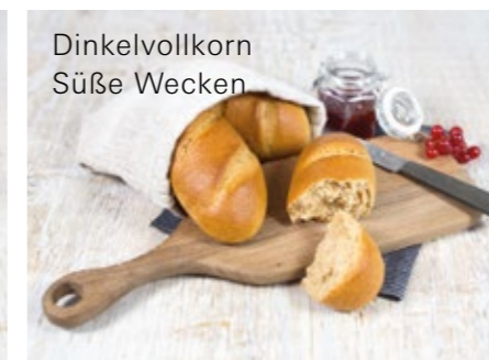
Dinkelvollkorn Süße Wecken